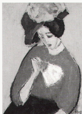
Museum Wiesbaden, Alexej von Jawlensky, Dame mit Fächer, 1909