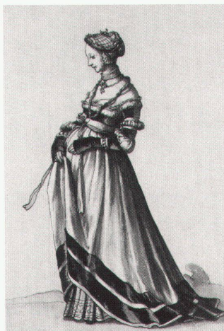
Kunstmuseum Basel, Hans Holbein d.J., Adelige Baslerin um 1523

«The Forest» – Sculpture, paintings bis 15.6.