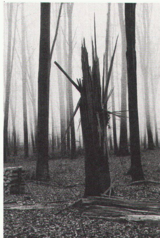
Museum für Kunst und Geschichte Freiburg, Michel Vanden Eeckhoudt, Gütschwald, Lucerne, 1990

Genève, Maison Tavel Maquettes d'une ville, Genève 1850–Genève 2001 bis 6.10.1991 Histoire monétaire de Genève (Présentation permanente)