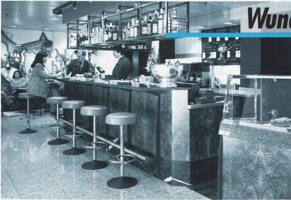
Bar Grand City, Hauptbahnhof Zürich / Projekt: Inter-Gastro-Design