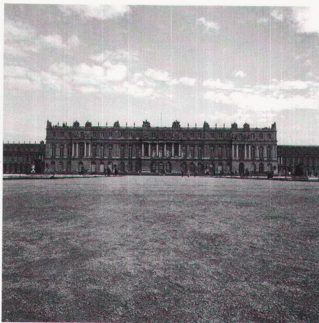
Schloos Versailles 1612-70, L. Leveau, J. H. Mansart