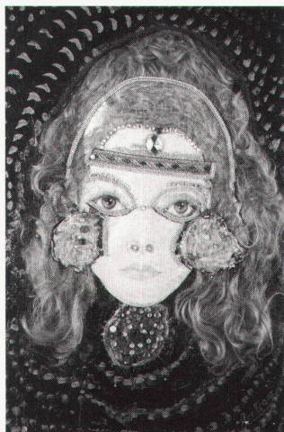
Museum im Lagerhaus, St. Gallen: Bertram, Tête de femme

Wuppertal, von der Heydt-Museum Max Peiffer-Watenphul bis 5.5.