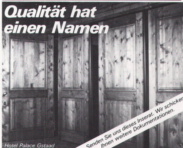
Hotel Palace Gstaad

Senden Sie uns dieses Inserat. Wir schicken Ihnen weitere Dokumentationen.