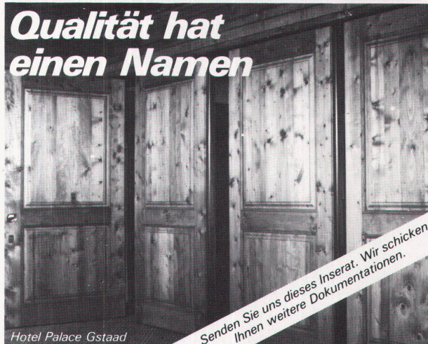
Hotel Palace Gstaad

Senden Sie uns dieses Inserat. Wir schicken Ihnen weitere Dokumentationen.