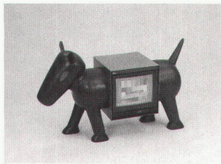
T.ier – V.ision

Im Rückenwind. Die StipendiatInnen des Eidgenössischen Stipendiums für angewandte Kunst 1990 bis 21.4.