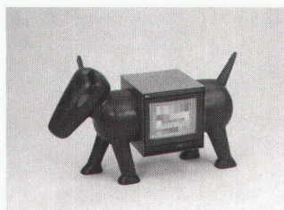
T.ier – V.ision

Im Rückenwind. Die StipendiatInnen des Eidgenössischen Stipendiums für angewandte Kunst 1990 bis 21.4.