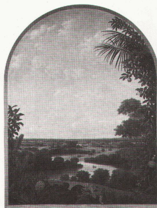
Tübingen: Frans Post, Brasilianische Landschaft

Italian Renaissance Frames bis 6.1.1991 Art of Central Africa bis 4.11.