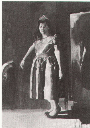
Musée cantonal des Beaux-Arts Lausanne: Eric Fischl, The Green Dress, 1987

Liverpool, Tate Gallery Francis Bacon Expression & Engagement – Ger-