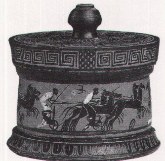
Attische Pyxis mit schwarzen Figuren

Le Corps et l'esprit – Trésors de la Grèce antique bis 15.7.