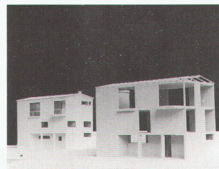
Atelierhaus Bill, 1932

Baukonstruktion der Moderne – Eine Analyse ausgewählter Schweizer Bauten bis 12.1.1990