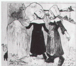
Paul Gauguin, The Joys of Brittany, 1889

Colour into Line: Turner and the Art of Engraving bis 21.1.1990