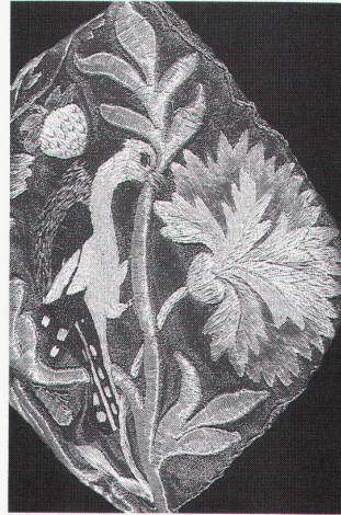
Kinderhaube aus Stampa, 18./19. Jahrhundert

Textilien aus sechs Jahrhunderten bis 31.3.1989