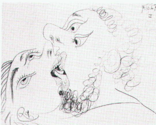
Pablo Picasso: The Kiss (IV)

Tate Gallery London Late Picasso – Bilder, Skulpturen, Zeichnungen und Drucke bis 18.9.