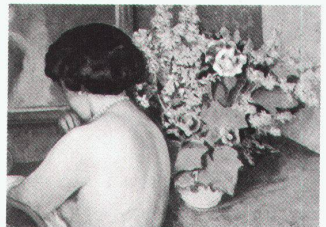
Gustave François: «Femme et fleurs»

Shingon, die Kunst des Geheimen Buddhismus in Japan 24.9.–27.11.