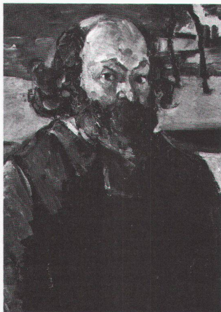
Cézanne: Selbstporträt 1872 (Detail)

Von Matisse bis Picasso Meisterwerke der Moderne, entdeckt von Siegfried Rosengart bis 11.9.