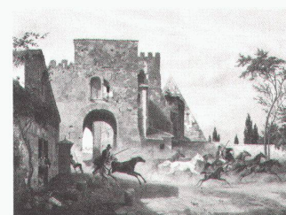
Ludwig Max Pratorius: Die Porta S. Paolo und die Cestiuspyramide in Rom, 1847

Ludwig Max Pratorius – Reisen nach Rom 1844–1856 bis 15.5.