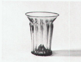
Rippenbecher aus farblosem Glas mit blauem Randfaden, 13. und frühes 14. Jahrhundert

Phönix aus Sand und Asche – Glas des Mittelalters 21.4.–24.7.