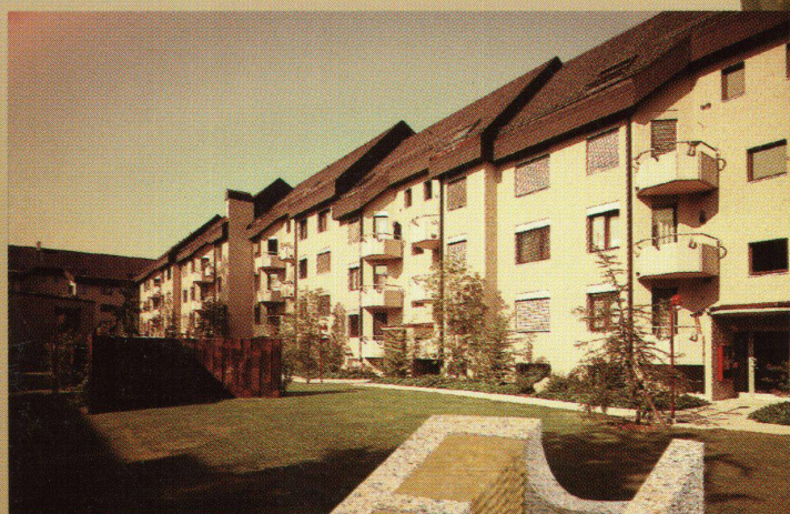
Atelier René Villiger ASG Sins