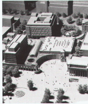
Die Arbeit von H. N. Cobb in I. M. Pei, New York gefiel der Stadt.

Wir sind aus dem Bewusstsein der Verantwortung für die Baukultur in unserem Lande anderer Meinung. Auch wenn wir anerkennen, dass durch das lange Planungsverfahren die Stadt Stuttgart zum Ausdruck gebracht hat, dass hier eine städtebauliche, baukünstlerische Aufgabe von höchstem Range ansteht, müssen wir