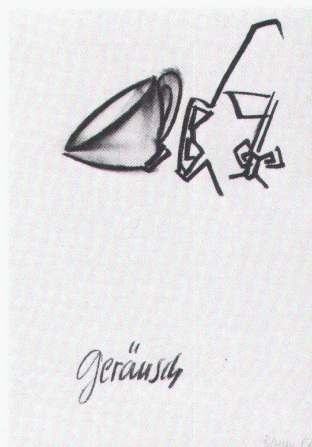
Bernh. Joh. Blume, Geräusch, 1987

Galerie René Ziegler Zürich Meret Oppenheim – Werke aus dem Nachlass bis 28.11.