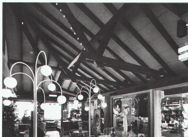
Autobahnrestaurant Mövenpick in Yverne-Aigle VD: 1200 m 2 Schichtex-Spezial 75/III, in Speziallängen, mit Längsfalz und Strukturanstrich, weiss gebrochen, auf Holzpfetten montiert.

Mit dem Schichtex-System wird die Halle von oben gegen Kälte und Wärme gedämmt und dadurch die Konstruktion geschützt. Die leichten, stark dämmenden und doch widerstandsfähigen Schichtex-Platten können auf verschiedene Arten in Spannweiten bis 5 m verlegt werden. Durch die über den Platten überlappt und verklebt aufgebrachte Armitex-