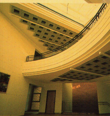
Atelier René Villiger ASG, Sins

Leisten Sie sich das Bessere, verlangen Sie mehr. Zum Beispiel in Sachen Schallabsorption, K-Wert, Ästhetik, Montagezeit, Service, Garantie!