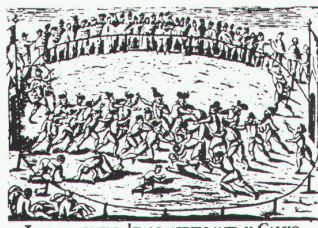
LVDVS QVEM ITALI APPELLANT IL CALGIO