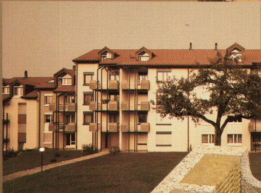
Atelier René Villiger ASG, Sina