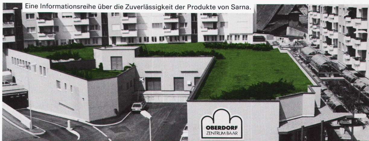
Eine Informationsreihe über die Zuverlässigkeit der Produkte von Sarna.

Werner Hochuli AG Hobelwerk und Holzhandel, 5056 Attelwil/AG, Tel. 064/83 22 21