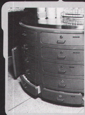
▲ Beispiel: Buffet-Anlage

Poly ester- Mantel (2-3 mm dick) für Holzbauteile