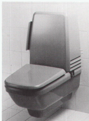
Die neue WC-Generation: Propomat von Geberit mit Warmwasserdusche, Fön und Geruchvernichter, ausgezeichnet mit dem Preis für gute Gestaltung «design '85 stuttgart».