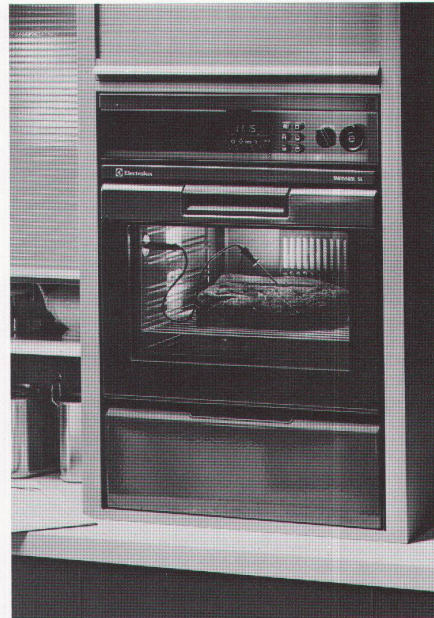
Einbaugeräte SL 6