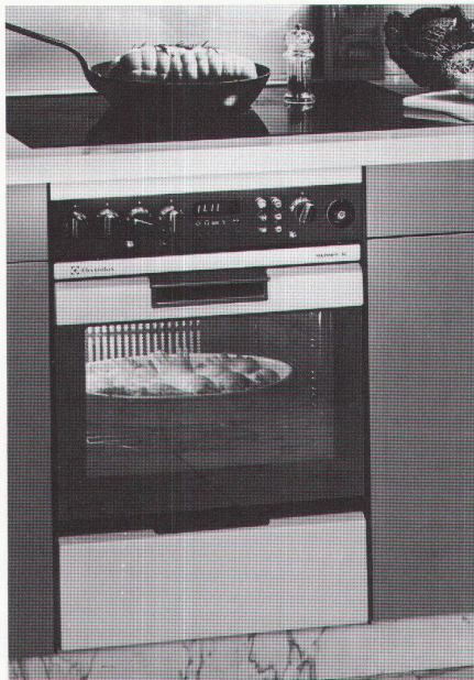
Einbaugeräte SL 6

verhindert, dass es in der ganzen Wohnung nach Essen riecht und hält die angrenzenden Möbel kühl. Jetzt können Sie die umliegenden Tablare bedenkenlos für die Aufbewahrung von Lebensmitteln benutzen.