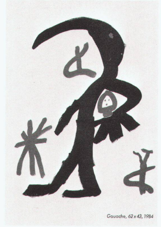
Gouache, 62 x 43, 1984