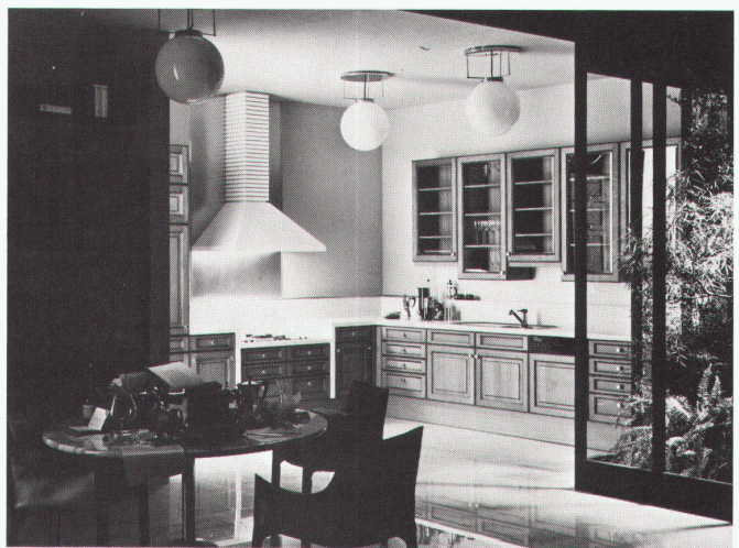
Toledo Patina Profil-Küche