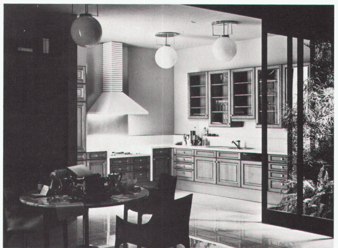
Toledo Patina Profil-Küche

bulthaup Schweiz: Vonplan AG, 8002 Zürich