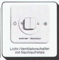
Licht-/Ventilatorschalter mit Nachlaufrelais