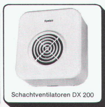
Schachtventilatoren DX 200