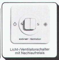
Licht-/Ventilatorschalter mit Nachlaufrelais