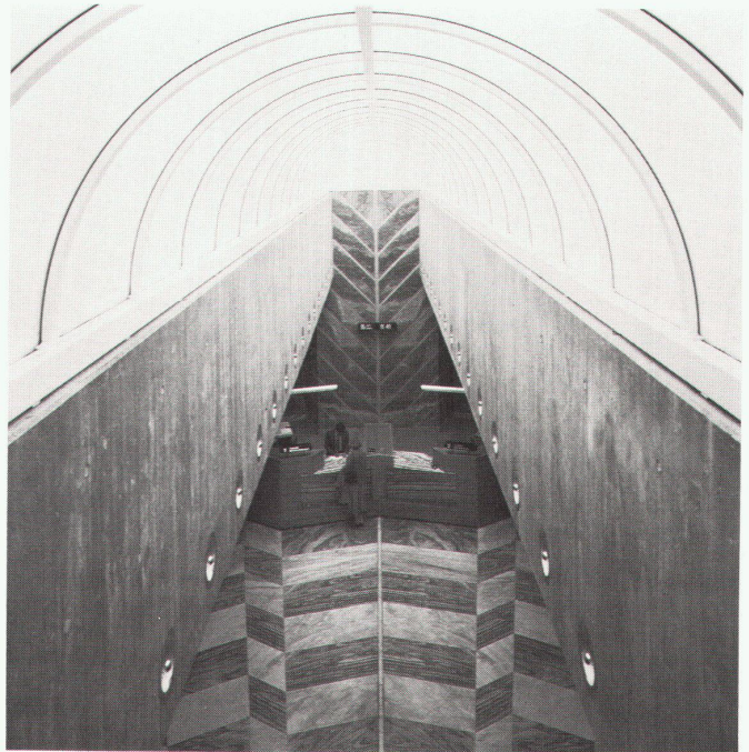
Mario Botta: Banque L'Etat à Fribourg