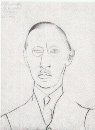
Pablo Picasso: Portrait Igor Strawinsky, Rom 1917

Strawinsky – sein Nachlass, sein Bild bis 9.9.