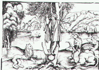
Holzschnitt zu Niclaus Moler, 1507

Universitätsbibliothek Basel Basler Buchillustration 1500–1545 bis 30.6.