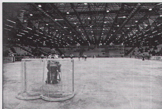
Eissporthalle Frankfurt/M. Das Raumfachwerk hat ein Rastermaß von 3,60 m und eine max. Stützweite von 54,0 m

Wir senden Ihnen gern ausführliche Unterlagen zu und beraten Sie auch, wenn Sie ein konkretes Bauobjekt planen