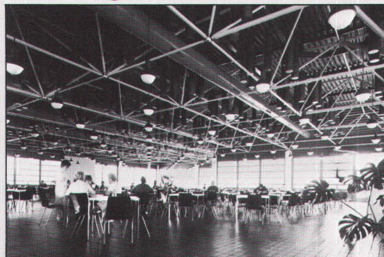
Robert Bosch GmbH, Werk Stuttgart-Feuerbach, Kasino. Das Raumfachwerk hat ein Rastermaß von 3,60 m