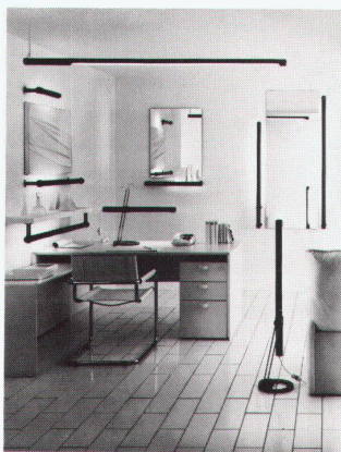
Kotzolt-Lichtstab 5000 als Tisch- und Wandleuchte