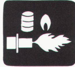
Gas- und Kombi-Öl/Gasbrenner