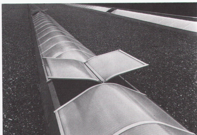
Teilansicht der 950 m 2 ISBA-Lichtbänder aus Plexiglas®- Stegdoppelplatten mit pneumatisch gesteuerten Lüftungs- flügeln Möbelfabrik K. Schuler, Rothenthurm

ISBA präsentiert an der SWISSBAU 83 – Halle 13 – Stand 361 Kunststoff-Bauelemente aus Acrylglas + Polycarbonat