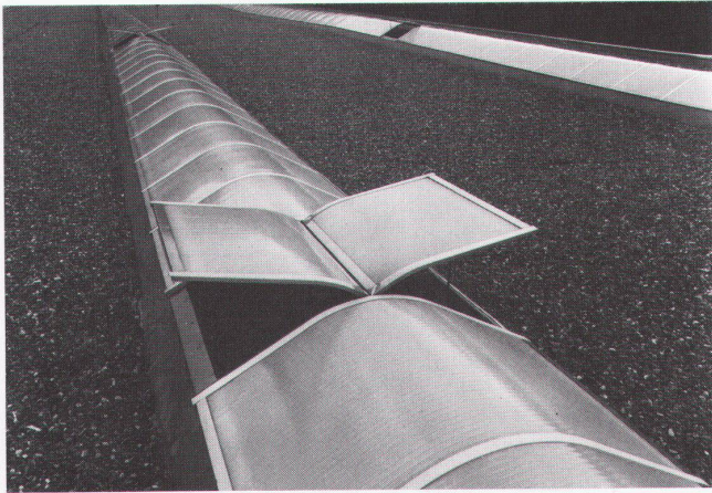
Teilansicht der 950 m 2 ISBA-Lichtbänder aus Plexiglas®-Stegdoppelplatten mit pneumatisch gesteuerten Lüftungsflügeln Möbelfabrik K. Schuler, Rothenthurm

ISBA präsentiert an der SWISSBAU 83 – Halle 13 – Stand 361 Kunststoff-Bauelemente aus Acrylglas + Polycarbonat