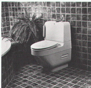
Der Geberit-o-mat ist eine kompakte WC-Anlage mit Warmwasserdusche, Fön und Geruchvernichter.

100 Jahren der Hersteller sanitärer Anlagen und Apparate, eine kompakte WC-Anlage entwickelt, die all diesen Bedürfnissen gerecht wird: den Geberit-o-mat. In seinem form-schönen Gehäuse befinden sich eine Warmwasserdusche, ein Warmluftfön und ein Geruchvernichter. Sobald man sich auf den WC-Ring setzt, schaltet sich der leise arbeitende Geruchvernichter ein. Die Luft wird direkt aus der Schüssel abgesogen, in einem Aktivkohlefilter vernichtet und anschliessend gereinigt wieder in den Raum abgegeben. Mit dem Absitzen schaltet sich auch automatisch ein kleiner Boiler ein, der das Duschwasser in kurzer Zeit auf 37 Grad Celsius erwärmt. Nach dem «Geschäft» greift man nicht mehr zum Papier, sondern betätigt einfach mit dem Ellbogen einen Hebel. Dadurch wird zunächst die Spülung ausgelöst. Drückt man den Hebel länger, fährt automatisch der Duscharm aus, der die Analgegend mit körperwarmem Wasser reinigt. Die Stärke des Duschstrahls ist vom Benutzer leicht selbst zu regulieren, selbst während des Duschens. Sobald man den Hebel loslässt, wird der Duschvorgang beendet, und der Duscharm verschwindet wieder in dem Gerät. Anschliessend tritt der Warmluftfön in Aktion. Er trocknet angenehm und schonend. Erst wenn man sich vom Geberit-o-mat erhebt, schaltet sich das Gerät von selbst aus.