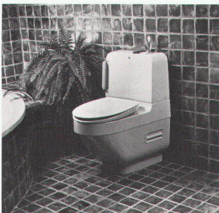
Der Geberit-o-mat ist eine kompakte WC-Anlage mit Warmwasserdusche, Fön und Geruchvernichter.

100 Jahren der Hersteller sanitärer Anlagen und Apparate, eine kompakte WC-Anlage entwickelt, die all diesen Bedürfnissen gerecht wird: den Geberit-o-mat. In seinem form-schönen Gehäuse befinden sich eine Warmwasserdusche, ein Warmluftfön und ein Geruchvernichter. Sobald man sich auf den WC-Ring setzt, schaltet sich der leise arbeitende Geruchvernichter ein. Die Luft wird direkt aus der Schüssel abgesogen, in einem Aktivkohlefilter vernichtet und anschliessend gereinigt wieder in den Raum abgegeben. Mit dem Absitzen schaltet sich auch automatisch ein kleiner Boiler ein, der das Duschwasser in kurzer Zeit auf 37 Grad Celsius erwärmt. Nach dem «Geschäft» greift man nicht mehr zum Papier, sondern betätigt einfach mit dem Ellbogen einen Hebel. Dadurch wird zunächst die Spülung ausgelöst. Drückt man den Hebel länger, fährt automatisch der Duscharm aus, der die Analengegend mit körperwarmem Wasser reinigt. Die Stärke des Duschstrahls ist vom Benutzer leicht selbst zu regulieren, selbst während des Duschens. Sobald man den Hebel loslässt, wird der Duschvorgang beendet, und der Duscharm verschwindet wieder in dem Gerät. Anschliessend tritt der Warmluftfön in Aktion. Er trocknet angenehm und schonend. Erst wenn man sich vom Geberit-o-mat erhebt, schaltet sich das Gerät von selbst aus.