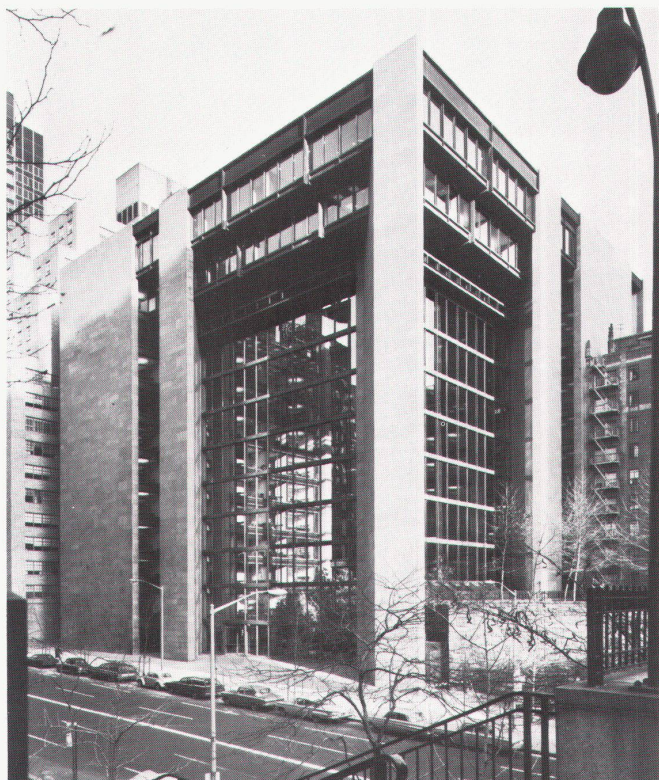
Ford Foundation, New York City

Further information: Japan Design Foundation, Semba Center Building No. 4, Higashi-ku, Osaka, 541 Japan.