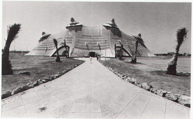
Mehrzweckhalle für den Nahen Osten in Jeddah (siehe auch WBW Nr. 1/2-1981)

Mit Frei Otto zeichnet der BDA einen der bedeutendsten Vertreter des zeitgenössischen Bauens