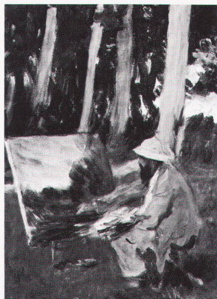
John Singer Sargent: Claude Monet Painting at the Edge of a Wood

Graham Sutherland bis 4.7. Paint & Painting bis 18.7. Julian Schnabel 30.6.–5.9. Giorgio de Chirico 4.8.–3.10.