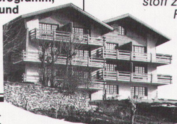
Einfamilienhäuser in Leukerbad, VS. Neubauten mit Holz/IV-Fenstern.

Ein vielseitiges Normprogramm, mit dem sich Fenster und Balkontüren beliebig kombinieren lassen, bietet Architekten und Bauherren unzählige vorteilhafte Lösungen.