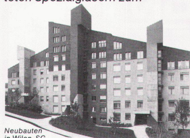
Neubauten in Wilen, SG. Überbauung mit Holz/IV-Fenstern.

Die Basiskonstruktion wird mit 3fach-Verglasung oder beschichteten Spezialgläsern zum