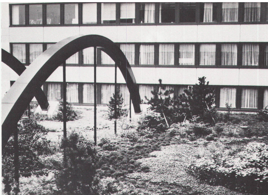
Objekt: Textil- und Modecenter Zürich-Opfikon. Ca. 1700 m 2 Dachbegrünung, Schichthöhe 35 cm. Generalunternehmer: Ortobau AG, Zürich. Architekt: von Tobel, Gurçan, H. Kehrer und Limburg, Zürich. Gartenarchitekt und Gartengestaltung: Fritz AG, Zürich.