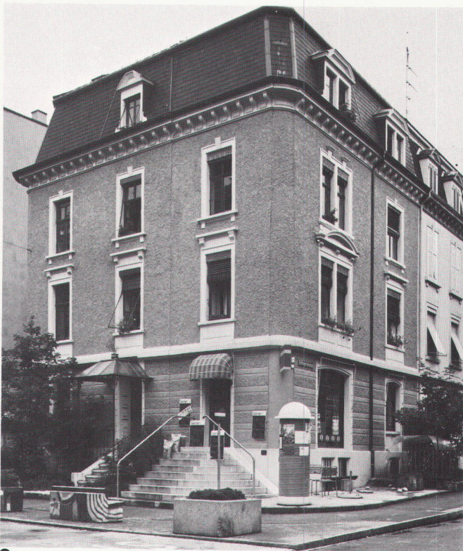
1 Geschäfts- und Wohnhaus Ecke Klybeckstrasse/Kandererstrasse (Architekt: Martin Koepf)