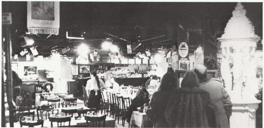
126 Paris. Le Lucernaire.

«...ich habe das Lucernaire also besucht; wirklich ein aussergewöhnlicher Ort. Publikum aus allen Gesellschaftsschichten findet sich da ein, ein Ort der Volksbegegnung im besten