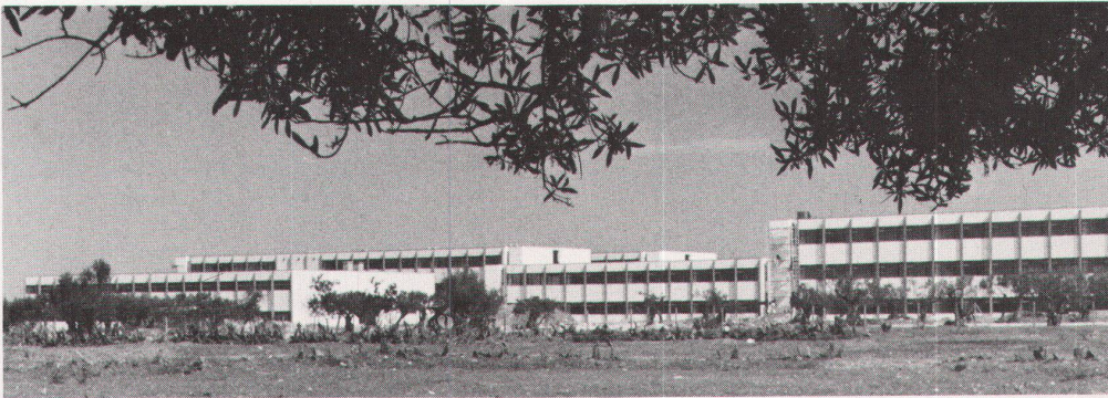
30 Universität Monastir. Ansicht von Nordwesten, im Frühjahr 1978 / Université Monastir. Vue côté nord-ouest, au printemps 1978.