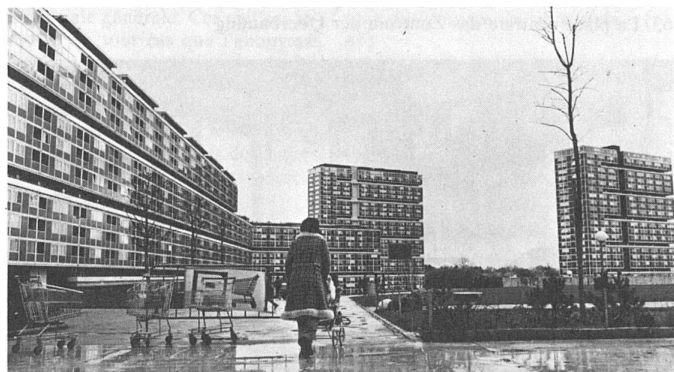
68 Pas de voitures, comme à la campagne/keine Autos, wie auf dem Lande

ferait un déséquilibre et beaucoup de frustrations en moins. Car le site peut bien être beau et le logement parfaitement confortable, on sent assez vite ce que peut produire comme vide une vie limitée à faire le ménage, à refaire des centaines de fois les mêmes promenades avec les enfants, à acheter des milliers de fois les mêmes matins au même magasin les mêmes produits, n'exerçant des activités que pour servir les autres, qu'ils s'appellent mari ou enfant sans se soucier jamais ou si rarement de ses envies et de ses désirs propres. Situation encore aggravée par le fait qu'entre ces femmes qui ont tant de problèmes communs, il ne se passe rien; que les relations restent superficielles, chacune essayant pour son propre compte de résoudre, avec plus ou moins de bonheur, les conflits et les difficultés que crée nécessairement le rôle auquel cette société destine «le deuxième sexe».