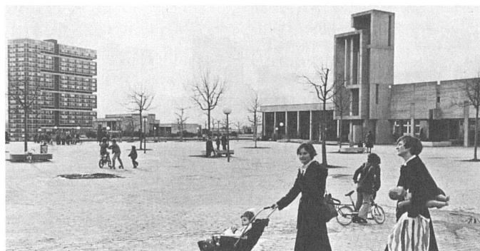
63 La place centrale/das Zentrum der Überbauung