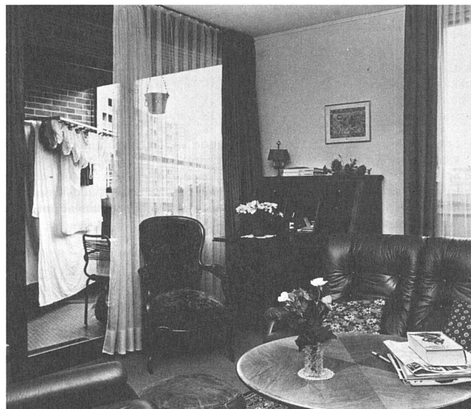
60 Une loggia utilisable.../brauchbarer Balkon...

chez-soi. Il y a eu depuis les années 60 une évolution spectaculaire de l'attitude face au logement. En France par exemple, c'est à partir de cette période qu'on observe un changement radical dans l'organisation du budget, notamment dans la classe ouvrière: les sommes consacrées au logement augmentent bien plus rapidement que celles consacrées aux autres dépenses. Avec le même revenu, les habitants sont prêts à doubler la part nécessaire au loyer.