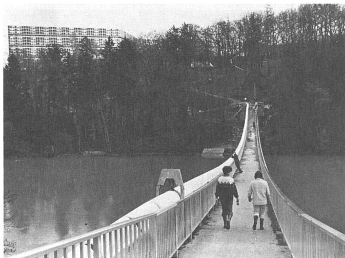
62 ...se promener dans les alentours/Spaziergänge in der Umgebung