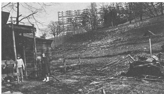
61 Le jardin Robinson/Robinson-Kinderspielplatz

Deux types d'animation sont tentés au Lignon. L'une s'inscrit dans un cadre d'intégration sociale, c'est un nouvel appel à la passivité: «nous vous indiquons non seulement comment vous alimenter et vous vêtir, mais encore comment vous distraire». L'autre