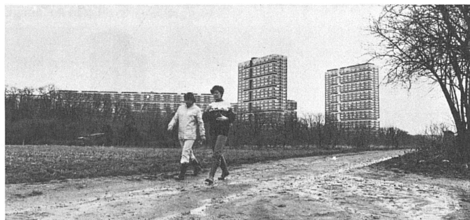
67 En attendant la rentrée des maris.../... bis die Männer nach Hause kommen