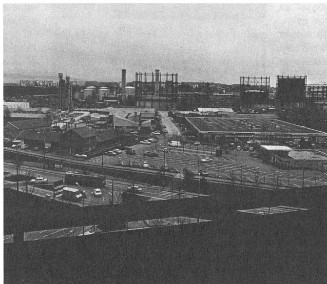
58 Les alentours/die unmittelbare Umgebung...

leurs sont modifiés 4 : compétition, individualisme, repli sur le chez-soi, relations sociales superficielles, développement de la consommation, jugement sur le statut social. Qu'est-ce qui est réellement à la base de ce changement radical?