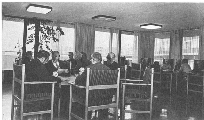
65 ...et celui des autres/... und jenes der anderen

Si l'on déplore amèrement le déséquilibre psychologique que crée pour les femmes le fait de passer des journées entières seulement en compagnie d'autres femmes et d'enfants, on peut aussi voir là de manière flagrante que la société réserve encore aux femmes et uniquement à elles les tâches d'éducation des enfants. Imaginons une Cité du Lignon où hommes et femmes iraient indifféremment travailler à l'extérieur et élèveraient les enfants... cela