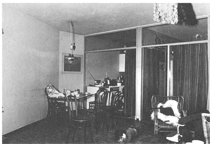
66 Chez moi/bei mir zu Hause