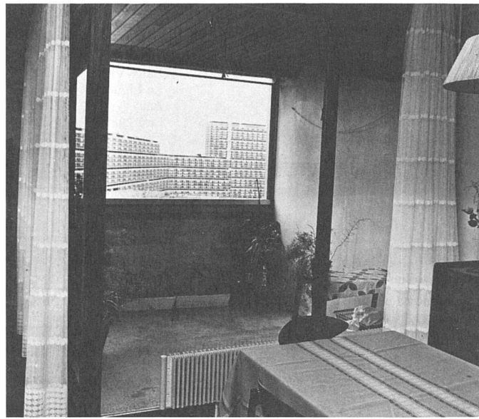
59 Le reflet de l'image/die Identifizierungsmöglichkeit...

L'investissement affectif dans le logement n'est pas un phénomène propre aux grands ensembles. Par contre, ceux-ci par leur structure, leur unifonctionnalité, favorisent la tendance au repli sur