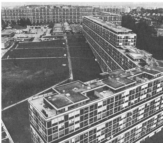
57 Vue depuis l'immeuble tours/die Überbauung, vom Hochhaus aus gesehen

Et puis, avec la rénovation et le nouveau logement, à la fois le mode de vie et le système de va-