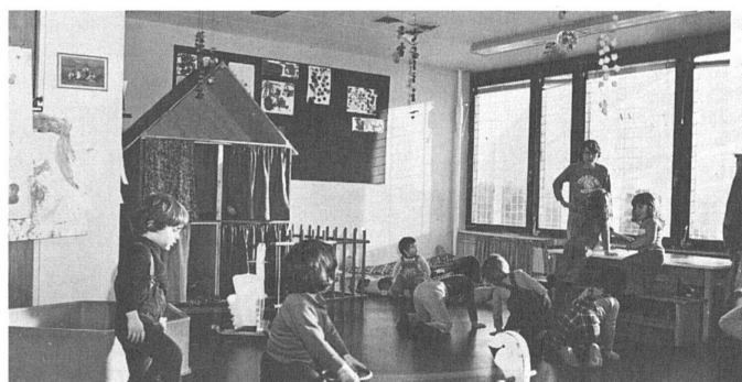
64 Le ghetto des uns.../das Ghetto der einen...

a pour objectif une prise de conscience des conditions de vie et l'acquisition de moyens permettant de les transformer.