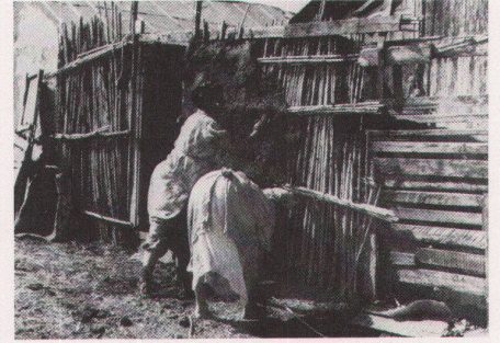
6 Ghana: Ankunft einer Ladung von Konsumgütern. Auf analoge Weise wurden auch vorfabrizierte Bauelemente an Land gebracht (nach Charles Abrams, op. cit. ) / Ghana: Arrivée d'une charge de biens de consommation. D'une manière analogue on avait déchargé des éléments de construction préfabriqués (d'après Charles Abrams, op. cit. ) 7 «Squatter-Settlement» in Puerto Rico / Bidonville à Puerto Rico. 8 Holz- und Schilfrohr-Häuser in Marokko / Maisons en bois et roseaux au Maroc.

Geld in Wirklichkeit geht und wessen Interessen in Wirklichkeit gedient wird.