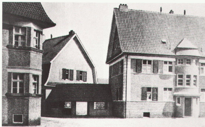
2 Baubüro der Firma Krupp (Leiter R. Schmohl): Kolonie Emscher-Lippe, Recklinghausen (ab 1907) / Bureau de construction de l'entreprise Krupp (direction R. Schmohl): colonie Emscher-Lippe, Recklinghausen (à partir de 1907).

Geschichte und Organisation des Heimatschutzes vor 1914 sollen exemplarisch am Beispiel des Deutschen «Bundes Heimatschutz», dem mitgliedstärksten und wohl einflussreichsten europäischen Heimatschutzbund, vorggeführt werden. Heimatschutz ist als Erweiterung des im 19. Jahrhundert institutionalisierten Denkmalschutzes anzusehen – ab 1905 fanden gemeinsame Tagungen der Denkmalpflege und des «Bundes Heimatschutz» statt –, der nun auch den Naturschutz und den Landschaftsschutz