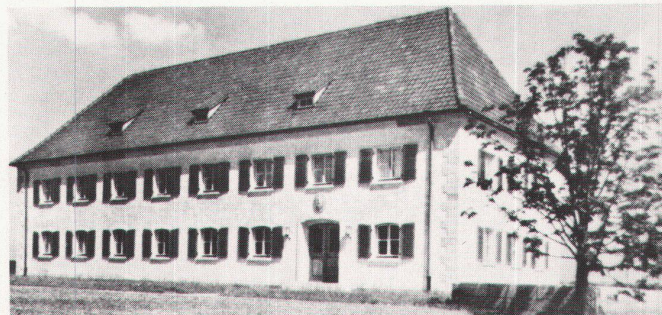
8 K. Dübbers: Strassenmeisterei, Eisenach (1935) / K. Dübbers: Service des routes, Eisenach (1935).

chitektonischen Formsprache streben die Vertreter der Heimatschutzbewegung vor 1914 eine Eindämmung der Grossstadt an, die sie einmal von der Allmacht des Geldes (Grosskapital), zum anderen vom Proletariat beherrscht sahen; letzterem warfen sie vor, für die Niederlegung der Standes- und Nationalitätenschränken zu kämpfen. Jedoch lehnte die Mehrheit der Heimatschutzvertreter die Stadt nicht grundsätzlich ab, sondern strebte ihre «Gesundung» durch die Umwandlung der Grossstädte in Kleinstädte an (Entballung der Stadt). Das Wohnen in einem von einem Garten umgebenen Einfamilienhaus – Garten als Stück «freie Natur», das den «natürlichen Lebenszusammenhang» wiederherstellt – war als Gegengewicht zu dem «entfremdeten Leben» in der Grossstadt gedacht (Mietskaserne). Das Einfamilienhaus = Eigenheim sollte sowohl den Ausgleich zwischen Land und Stadt schaffen als auch durch wiederhergestellte «Heimatbindung» des Grossstädtlers die «soziale Harmonie» bewirken. Als wesentliche Beiträge zur «Gesundung» der Städte wurden darüber hinaus die «Zonung» der Städte und die «Zeilenbauweise» – die «schlichte Reihung von Einfamilienhäusern» – propagiert. Diese städtebaulichen Leitbilder wurden auch von den Vertretern des «neuen Bauens» übernommen. Da die Altstadtbereiche unangetastet blieben und zunehmend Cityfunktionen übernahmen, setzte Ende des 19. Jahrhunderts die Expansion der Vorstädte ein.