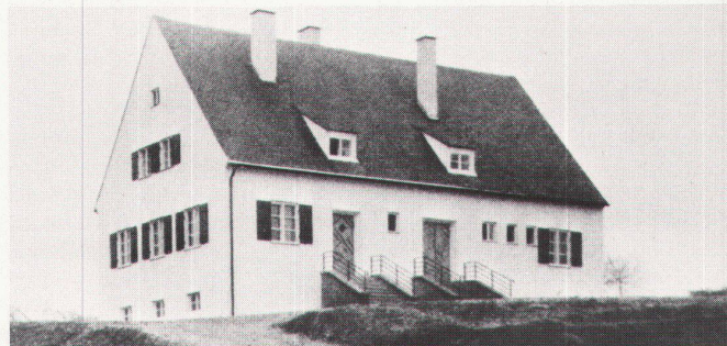
7 G. Holzbauer: Schule in Bergen b. Moosburg (1936) / G. Holzbauer: Ecole à Bergen b. Moosburg (1936).