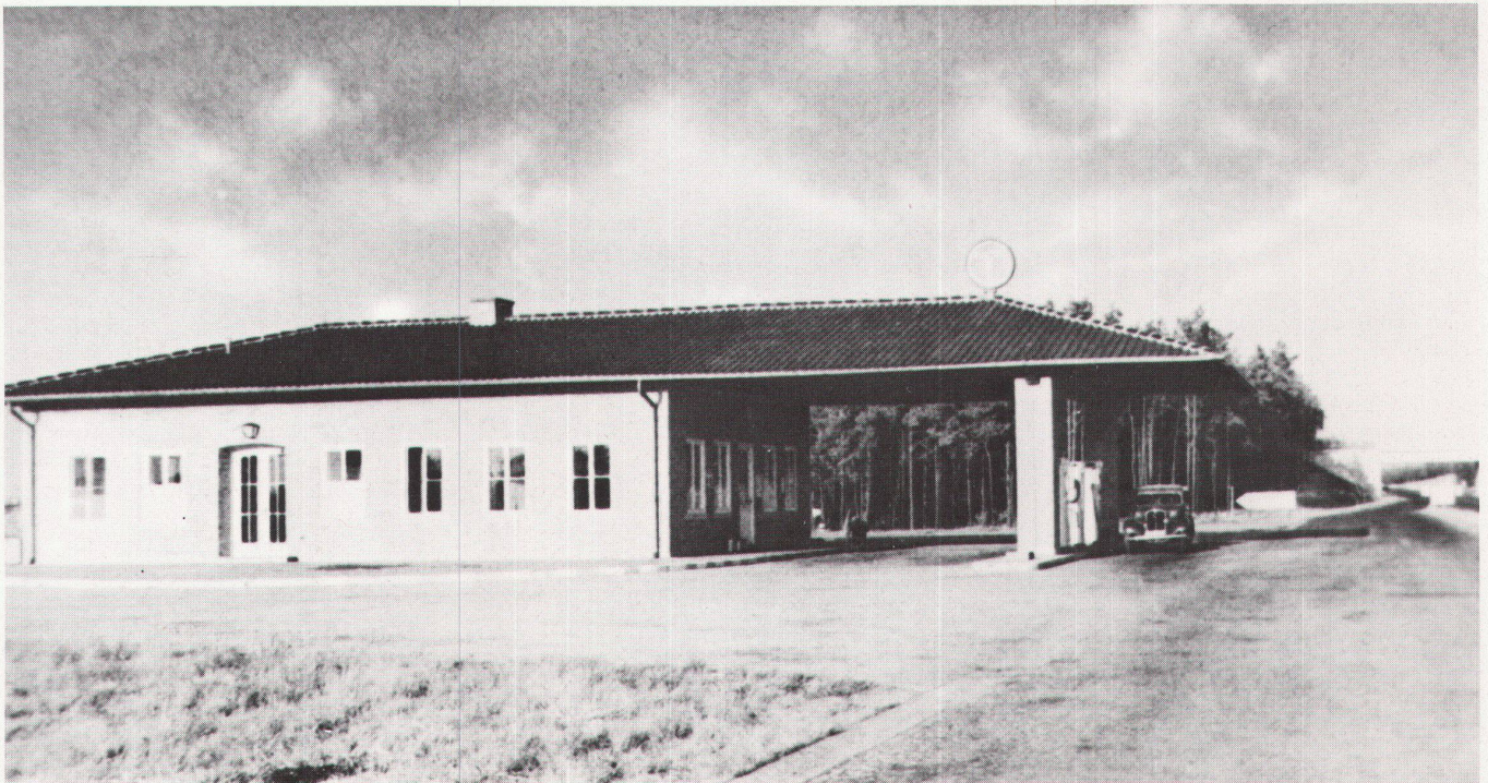
1 F. Tamms: deutsche Autobahntankstelle (ca. 1935) / F. Tamms: station d'essence sur une autoroute en Allemagne (autour de 1935).

diesen sozialökonomischen Umwandlungsprozess bildeten sich seit den 90er Jahren des 19. Jahrhunderts unterschiedliche Bestrebungen, die vor allem «den kulturellen Niedergang» aufhalten wollten und unter der Bezeichnung «kultur- und lebensreformerische Bewegungen» zusammengefasst werden (u.a. Bodenreform-, Siedlungs- und Gartenstadtbewegung). 3 Ihre Wortführer beschrieben eindrucksvoll die Symptome und Folgen der Industrialisierung: Landflucht und Grossstadtbildung, «Verwüstung der Kulturlandschaft» durch das Verkehrswesen (u.a. Bergbah-