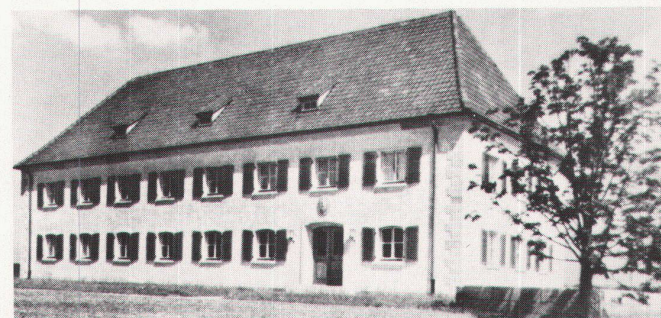
8 K. Dübbers: Strassenmeisterei, Eisenach (1935) / K. Dübbers: Service des routes, Eisenach (1935).

chitektonischen Formensprache strebten die Vertreter der Heimatschutzbewegung vor 1914 eine Eindämmung der Grossstadt an, die sie einmal von der Allmacht des Geldes (Grosskapital), zum anderen vom Proletariat beherrscht sahen; letzterem warfen sie vor, für die Niederlegung der Standes- und Nationalitätenschränken zu kämpfen. Jedoch lehnte die Mehrheit der Heimatschutzvertreter die Stadt nicht grundsätzlich ab, sondern strebte ihre «Gesundung» durch die Umwandlung der Grossstädte in Kleinstädte an (Entballung der Stadt). Das Wohnen in einem von einem Garten umgebenen Einfamilienhaus – Garten als Stück «freie Natur», das den «natürlichen Lebenszusammenhang» wiederherstellt – war als Gegengewicht zu dem «entfremdeten Leben» in der Grossstadt gedacht (Mietskaserne). Das Einfamilienhaus = Eigenheim sollte sowohl den Ausgleich zwischen Land und Stadt schaffen als auch durch wiederhergestellte «Heimatbindung» des Grossstädters die «soziale Harmonie» bewirken. Als wesentliche Beiträge zur «Gesundung» der Städte wurden darüber hinaus die «Zonung» der Städte und die «Zeilenbauweise» – die «schlichte Reihung von Einfamilienhäusern» – propagiert. Diese städtebaulichen Leitbilder wurden auch von den Vertretern des «neuen Bauens» übernommen. Da die Altstadtbereiche unangetastet blieben und zunehmend Cityfunktionen übernahmen, setzte Ende des 19. Jahrhunderts die Expansion der Vorstädte ein.