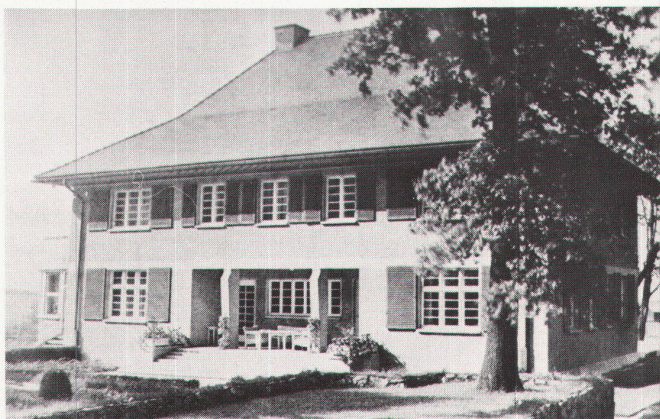
5 O. R. Salvisberg: Landhaus in Falkenstein i. V. (ca. 1928) / O. R. Salvisberg: Villa à Falkenstein (autour de 1928).