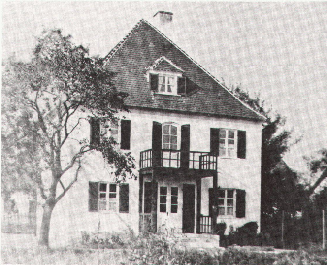
4 Lechner & Norkau: Bürgerliches Wohnhaus in Weilheim (1927–28) / Lechner et Norkau: Habitation bourgeoise à Weilheim (1927–28).

umfasste und auch die anonyme historische Architektur als schutzwürdig erkannte (Ensembleschutz). Der Begriff «Heimatschutz» wurde 1898 von E. Rudorff geprägt 6 , der sich seit den 80er Jahren des 19. Jahrhunderts auch für den Naturschutz einsetzte.