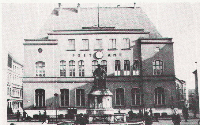
6 Umwandlung einer gotischen Posthausfassade in Köln-Kalk (1926–1927) / Transformation d'une façade d'un hôtel de poste originellement en style gothique à Cologne (1926–27).